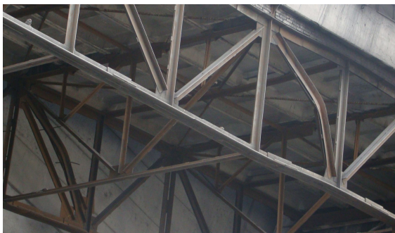
Рис. 2. Фрагмент галереи транспортеров с повреждениями

Предполагаемой причиной возникновения аварийной ситуации является скопление просыпи угля на верхней части галереи транспортеров.