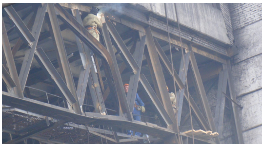
Рис. 5. Работы по замене раскоса

Применение варианта усиления главных ферм транспортной галереи №16 при помощи создания в четырех панелях крестовой системы решетки (рис. 6) позволило перераспределить между элементами ферм на приопорных участках дополнительные усилия от снеговой нагрузки и просыпей угля, а также вдвое уменьшить расчетную длину в плоскости ферм сжатых раскосов.