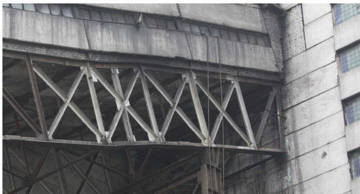
Рис. 6. Ферма после усиления

Применение варианта усиления главных ферм транспортной галереи №16 при помощи создания в четырех панелях крестовой системы решетки (рис. 6) позволило перераспределить между элементами ферм на приопорных участках дополнительные усилия от снеговой нагрузки и просыпей угля, а также вдвое уменьшить расчетную длину в плоскости ферм сжатых раскосов.